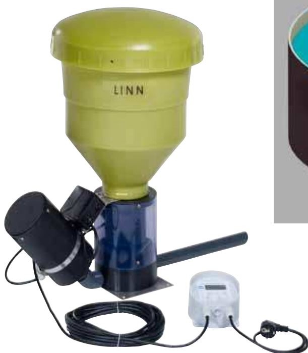
Пневматическая кормушка PROFI-AUTOMATIK 20 кг.

Пневматические автоматические кормушки PROFI-AUTOMATIK можно подключить к общей системе автоматизации. При помощи компьютера или через Интернет можно управлять сразу всеми кормушками индивидуально для каждого бассейна (см. раздел AQUA-FEED).