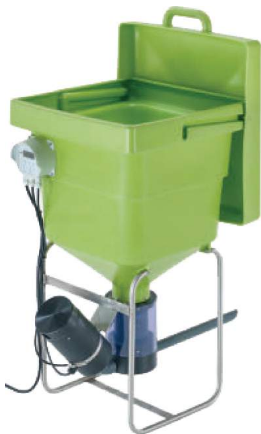
Пневматическая кормушка PROFI-AUTOMATIK 50 или 70кг.

Теперь эти кормушки оснащены более сильным пневматическим мотором 500 Вт, который может эффективно и без проблем выбрасывать большую массу корма. Преимущества очевидны. Воздушный поток обеспечивает разброс корма до 5 м.